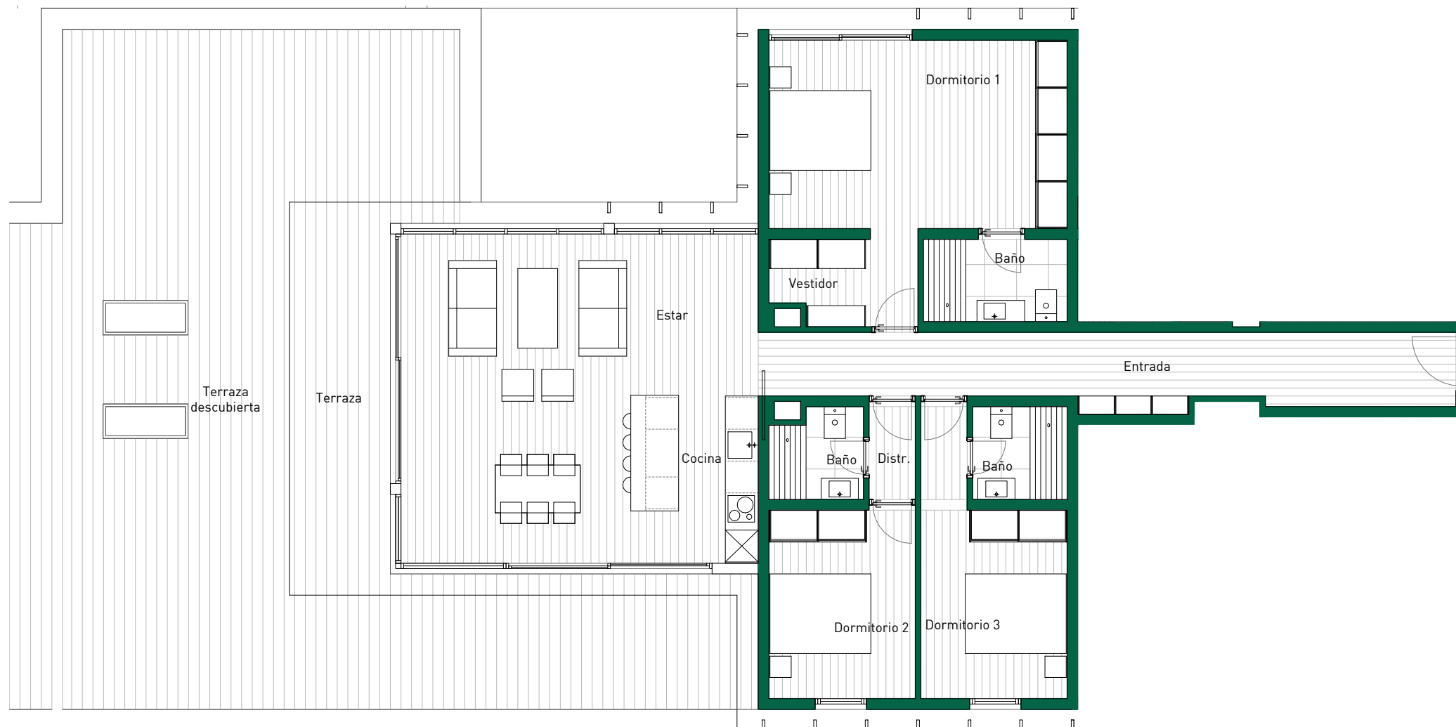
Detalle Planta vivienda